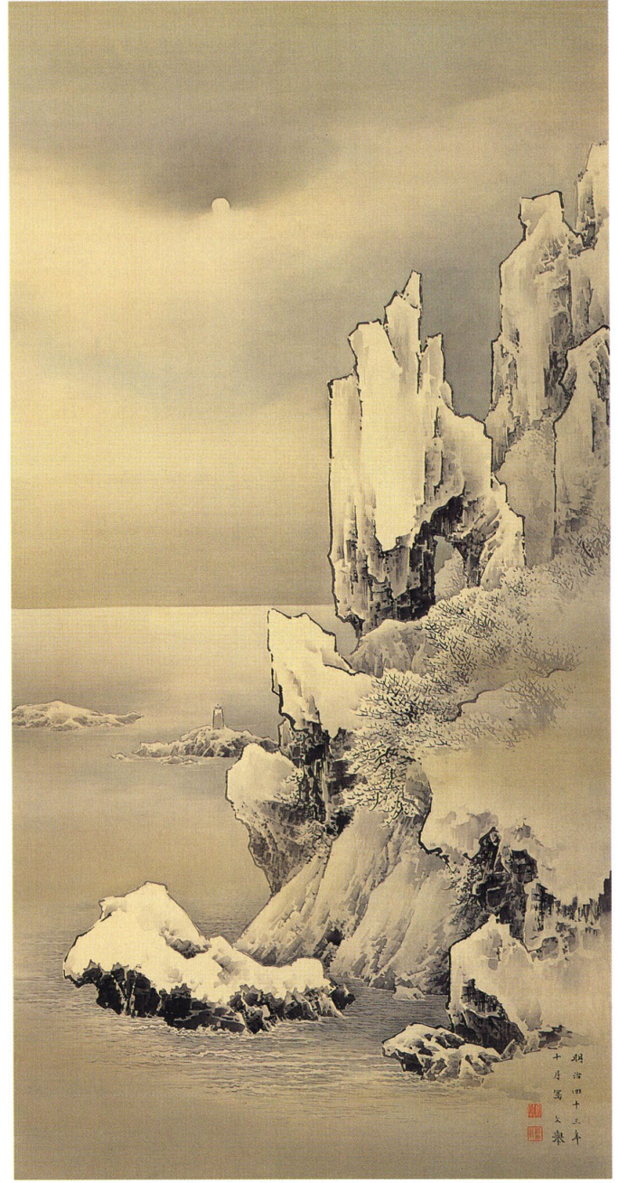
22 野村文举 《北海道忍路高島真景》 明治43年（1910）